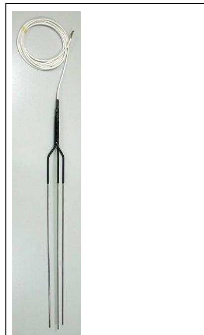
Widok czujnika poziomu cieczy - odmiana CZP-3KDYPAS...szer.wisz

uziemieniem lub przewodem ochronnym PE. Montaż elektryczny powinien wykonać kwalifikowany elektryk. Czujników nie wolno instalować i deinstalować, w warunkach zagrożenia (wysoka temperatura, ciśnienie, żrące media itp.) dla ludzi i/lub zwierząt..